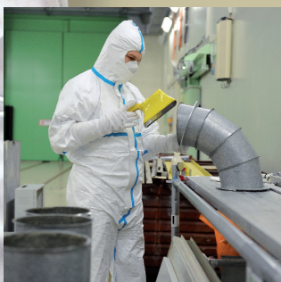
Auszunungen und nuklearer Rückbau Die Spezialteams von Peko machen kontaminierte Zonen wieder zu normal zugänglichen Räumen – und berücksichtigen dabei alle strahlenschutzrelevanten Vorschriften. Auszunungen übernehmen wir nicht nur in Kernkraftwerken, sondern auch in den Bereichen Medizin und Chemie.