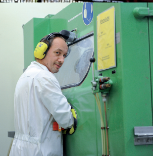
Dekontaminationen Wer in der kontrollierten Zone Reinigungs- und Dekontaminationsarbeiten ausführt, muss äusserst zuverlässig sein und über viel Fachwissen verfügen. Gern stellen wir Ihnen qualifizierte Fachleute zur Verfügung.