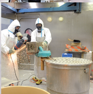
Nach Ihren Bedürfnissen Wir verleihen Ihnen aus den Reihen unserer fest angestellten Fachkräfte für jede gewünschte Dauer das kompetente Spezialteam.