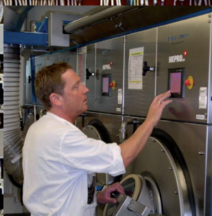
Textilreinigung in der Aktivwäscherei Unsere erfahrenen "Wäscher" behandeln kontaminierte Arbeitskleidung. Diese wird fachgerecht sortiert, gereinigt und anschliessend ausgemessen – während einer Revision auch rund um die Uhr.