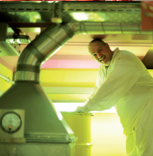
Revisionen Unterhaltsarbeiten an Nuklearanlagen erfordern besondere Kenntnisse und höhere Kapazitäten – wir stellen sie Ihnen zur Verfügung.