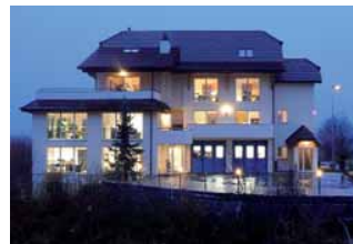
Peko AG, Hauptsitz

Gern übernehmen wir Ihre Fertigungsaufträge für kleine und grosse Serien – zum Beispiel von Apparate- und Schaltschränken, aber auch für den Prototypenbau, für AVOR und Logistik sowie für Konstruktions- und Zeichnungsarbeiten.