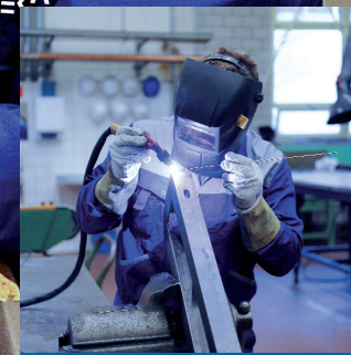
Mechaniker/Schlosser Die Peko AG beschäftigt Polymechniker, Schlosser, Schweisser und Monteur mit grosser Berufserfahrung.