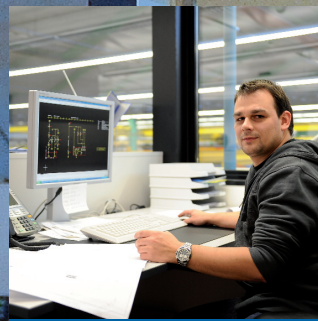
Techniker/Konstrukteure Sie haben Arbeiten für Elektro-, Maschinen-, Betriebstechniker, Projektleiter, Konstrukteure, CAD-Zeichner oder Ingenieure? Bei uns finden Sie die passende Unterstützung.