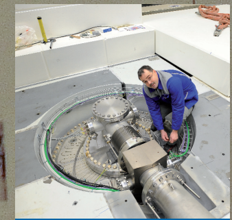
Nach Ihren Bedürfnissen Wir verleihen Ihnen aus den Reihen unserer fest angestellten Fachkräfte für jede gewünschte Dauer die kompetente Person.